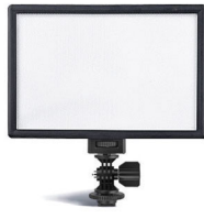
ICON LED Light Iluminación LED con display digital