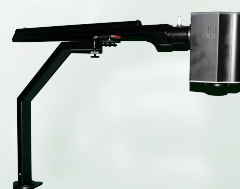
VISUS ICON Flex XY Rail System Microscopio digital ICON Flex + Sistema de rieles XY