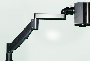
VISUS ICON Flex-AH Microscopio digital ICON Flex + soporte flexible.