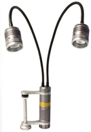
Iluminación 1 Cuello de cisne dual LED