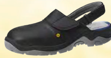
Zueco negro ESD ZP-32125

Tallas 36-42. Microfibra, negro. Forro transpirable con iones de plata. Correa de talón fija ajustable. Empeine ajustable con banda elástica. Velcro. Suela de PU antideslizante. Entresuela de PU anti-golpes. Punta de acero.