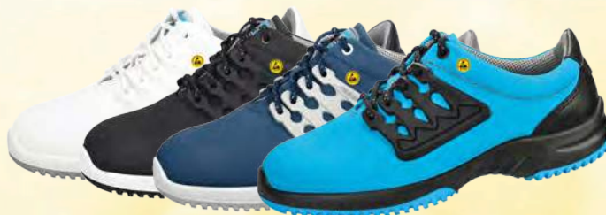
Zapato bajo colores ESD

Tallas 35-48. Cuero funcional con diseño de panel en diferentes colores. Forro transpirable con iones de plata. Empeine ajustable con cordones. Entresuela de espuma de poliuretano. Suela de TPU antideslizante. A prueba de arañazos. Impermeable. Antibacteriano.