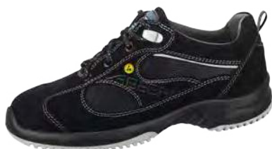
Zapato bajo ESD negro ZP-36701

Tallas 35-48. Velur con incrustaciones textiles transpirables, negro. Forro de microfibra, transpirable. Empeine ajustable con cordones. Entresuela de espuma de poliuretano. Material reflectante. Antibacteriano.