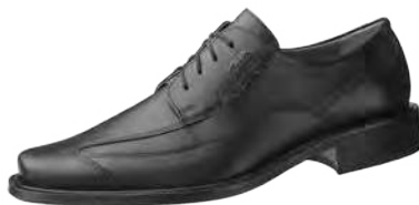
Zapatos de caballero. ZP-3120

Tallas 39-47. Piel de becerro, negro. Forro de microfibra, transpirable. Empeine con cordones. Suela de cuero disipativa ESD. Plantilla de cuero.