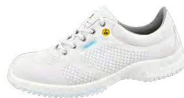
Zapato bajo blanco ESD ZP-36772

Tallas 35-48. Textil de punto, blanco. Forro transpirable con iones de plata. Empeine ajustable con cordones. Entresuela de espuma de poliuretano. Suela de TPU antideslizante. Protección contra salpicaduras. Antibacteriano.