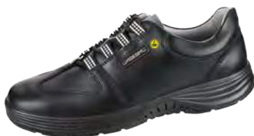
Zapato bajo negro ESD ZP-7131038

Tallas 35-48. Cuero liso, negro. Forro transpirable con iones de plata. Empeine ajustable con cordones. Suela de PU antideslizante. Punta de acero. Material reflectante. Antibacteriano.