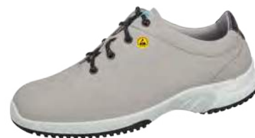
Zapato bajo gris/negros ESD ZP-36785

Tallas 35-48. Microfibra, gris/negro. Forro transpirable con iones de plata. Empeine ajustable con cordones. Entresuela de espuma de poliuretano Suela de TPU antideslizante. Antibacteriano. Disponible en varios colores.