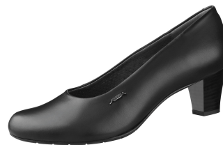
Zapatos de señora con tacón. ZP-3940

Tallas 36-42. Cuero liso, negro. Forro de microfibra, transpirable. Suela de cuero disipativa ESD. Tacón 60 mm.