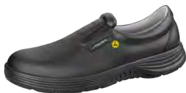
Zapato negro ESD estilo loafer ZP-7131037

Tallas 35-48. Cuero liso, negro. Forro transpirable con iones de plata. Entresuela con