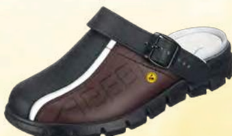
Zuecos negro/marrón ESD con impresión. ZP-37315

Tallas 35-48. Cuero liso, negro /marrón. Correa de talón plegable ajustable. Suela de TPU antideslizante. Disponible en otros colores. Antibacteriano.