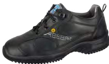
Zapato bajo negro ESD de cuero. ZP-36751

Tallas 35-48. Cuero liso, negro. Forro de microfibra, transpirable. Empeine ajustable con cordones. Entresuela de espuma de poliuretano. Suela de TPU antideslizante. Antibacteriano.