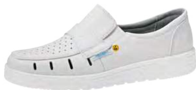
Zapato blanco ESD estilo loafer ZP-32300

Tallas 35-47. Cuero liso, perforado, blanco. Forro de microfibra transpirable. Empeine con banda elástica. Suela de PU antideslizante. Antibacteriano.