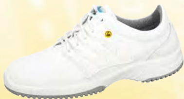
Zapato bajo blanco ESD ZP-31760

Tallas 35-48. Cuero funcional con diseño de panel, blanco. Forro transpirable con iones de plata. Empeine ajustable con cordones. Entresuela de espuma de poliuretano. Suela de TPU antideslizante. A prueba de arañazos. Impermeable. Antibacteriano.