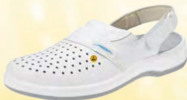
Zueco blanco ESD ZP-38600

Tallas 36-47. Cuero liso, perforado, blanco. Forro de microfibra, transpirable. Parche de microfibra en el talón. Correa de talón fija ajustable con velcro. Suela de PU antideslizante. Antibacteriano.