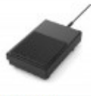
P405 - Pedal