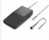
P005 - Pedal + Kit Adaptador