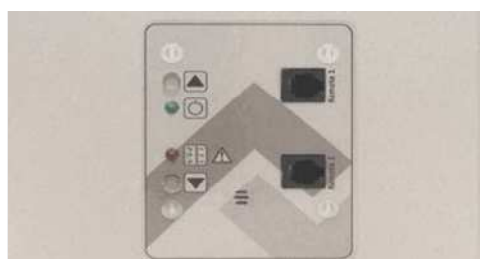
Panel de control sencillo y claro