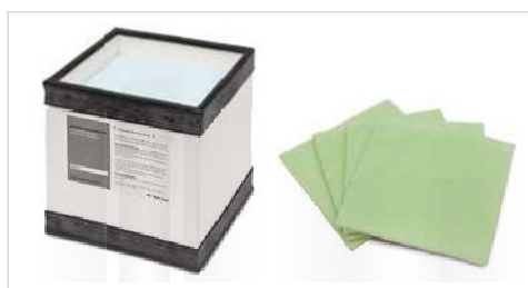
Filtros de alta calidad, Mismos filtros para EASY ARM1 y EASY ARM 2