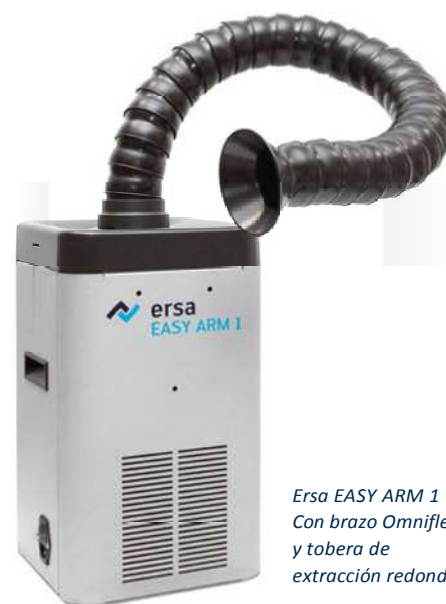
Ersa EASY ARM 1 Con brazo Omniflex y tobera de extracción redonda.

Para ahorrar energía y ayudar a ampliar la vida de los filtros, ambas unidades pueden conectarse con las estaciones i-CON o con un botón de "Standby", de manera que la unidad de extracción sólo funcionará mientras que la estación de soldadura a la que esté conectada esté trabajando, y se detendrá cuando la estación entre en modo de espera o "standby".